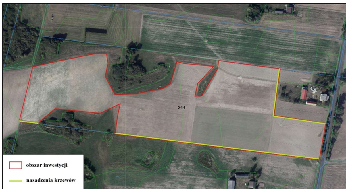
Rys. nr 2. Rozmieszczenie planowanych nasadzeń, zgodnie z planem zawartym w Kip.