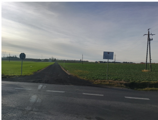
Droga Rokitnica Nowa- Świdziebnia

W 2022 roku przy udziale środków z budżetu Województwa Kujawsko-Pomorskiego pochodzących z tytułu wyłączenia gruntów z produkcji rolnej wybudowano drogę w miejscowości Rokitnica Nowa i Świdziebnia o długości 0,823 km w technologii nawierzchni tłuczniowej z powierzchniowym utwaleniem emulsją i grysami.